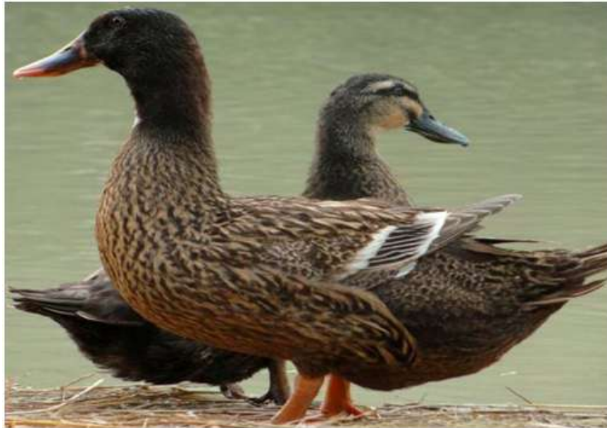
13-nji surat. Ukrain tohumy

Ak moskwa tohumy. Bu ördekleret we ýumurtga ugra degişli. Bu tohum ak pekin ördekleri bilen haki kempbell ördeklerini çakyşdyrmagyň esasynda döredilen.Çakyşdyrmanyň netijesinde alnan nesiller özüniň önümlilik hili we daşky alamatlary boýunça et ugurly ördeklere meňzeş bolupdyr.Ak moskwa tohumly ördekleriň diri agramy mäkiýanlaryňky 3,0-3,5kilograma, horazlarynyňky 4,0-4,5kilograma ýetýär. Jüýjeleri tiz ösýärler. 2 aýlykda jüýjeleriň diri agramy 2,5kilograma ýetýär. Ýumurtga berjiligi 130 sany. Ýumurtgasynyň agramy 90-100 gram.