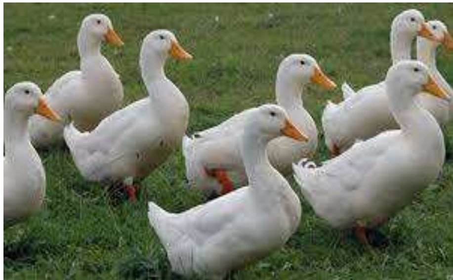
14-nji surat. Ak moskwa tohumy

Ak moskwa tohumy. Bu ördekleret we ýumurtga ugra degişli. Bu tohum ak pekin ördekleri bilen haki kempbell ördeklerini çakyşdyrmagyň esasynda döredilen.Çakyşdyrmanyň netijesinde alnan nesiller özüniň önümlilik hili we daşky alamatlary boýunça et ugurly ördeklere meňzeş bolupdyr.Ak moskwa tohumly ördekleriň diri agramy mäkiýanlaryňky 3,0-3,5kilograma, horazlarynyňky 4,0-4,5kilograma ýetýär. Jüýjeleri tiz ösýärler. 2 aýlykda jüýjeleriň diri agramy 2,5kilograma ýetýär. Ýumurtga berjiligi 130 sany. Ýumurtgasynyň agramy 90-100 gram.