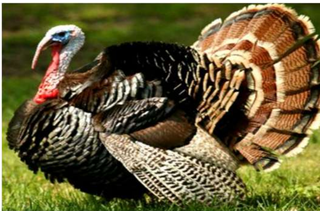
5-nji surat. Bürünçsöw giňdöşli hindi towugy

Bürünçsöw giňdöşli hindi towugy. Olar diri agramynyň ululygy we ösüşiniň tizliginiň ýokarydygy bilen tapawutlanýarlar. Uly ýaşly horazlarynyň diri agramy ortaça 16-18 kilograma barabardyr. 120 günlük ýaşyndaky hindi towugynyň jüýjeleri 5,5-6,5 kilogram gelýär, bir kilogram diri agramynyň artmagyna – 2,3-2,5 kilogram iým sarp edilýär. Uly ýaşly hindi towuklarynyň ýumurtga berijiligi 70-90-a çenli ýetýär, ýumurtgadan jüýje çykyjylygy – 65-70 göterime deňdir.