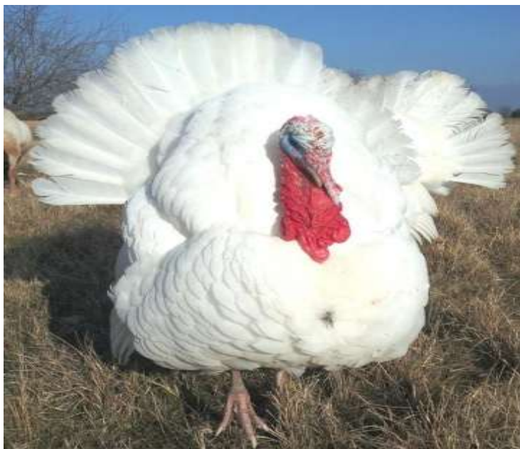
4-nji surat. Ak giňdöşli hindi towugy

80-85göterime, aram agramly görnüşiniňki - 60-70 göterime, agyr agramly görnüşiniňki – 50-55göterime ýetýär.