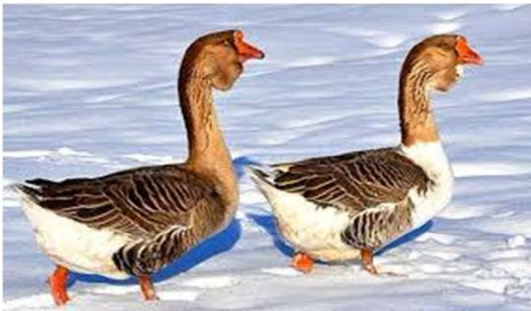
9-njy surat. Holmogor tohumly gazy

Holmogor tohumly gaz tohumy ýerli ak gazlary hytaý tohumyndan bolan gazlar bilen çakyşdyrmak arkaly döredilen. Holmogor tohumly gazlar özüniň ýokary diri agramlylygy we etiniň hili boýunça has tapawutlanýar. Mäkiýanlarynyň diri agramy 6-8 kilograma, horazlarynyňky bolsa 8-9 kilograma ýetýär. Bir ýylda ýumurtga berijiligi 30-50 sany, kä ýagdaýlarda 80 sany ýumurtga bermäge hem ukyply bolýarlar. Ýumurtgasynyň agramy 160-180 gram. Jüýjeleri et üçin çalt semreýärler we 9-hepdelik ýaşynda olaryň diri agramy 4 kilograma ýetýär. Holmogor gazlarynyň ýeleklere çal, ala we ak reňkli bolýarlar.