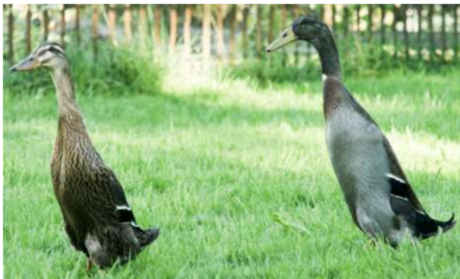
15-nji surat. Ýyndam hindi tohumy

Ýumurtgasynyň agramy 68-72 gram aralygynda bolýar. Horazlarynyň diri agramy 1,8-2,0 kilogram, mäkiýanlarynyňky 1,5-1,8 kilogram.