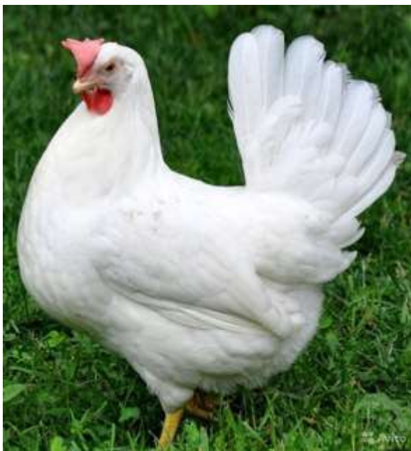
2-nji surat. Lomann-LSL krossy

berýärler. Ýumurtgalarynyň agramy 62-63 gram. Şolardan inkubasiýa goýmak üçinýaramlysy 68 hepdelikde-245-250, 72 hepdelikde-260-265 sany. Jüýjäniň çykymy ortaça – 80-83 göterime deňdir. Ýaşayşa ukyplylygy ortaça 90-96 göterim. Iými sarp edişi: 1-20 hepdelik ýaşynda 7,2 kilograma, 21-68 hepdelikde 28 kilograma deňdir.