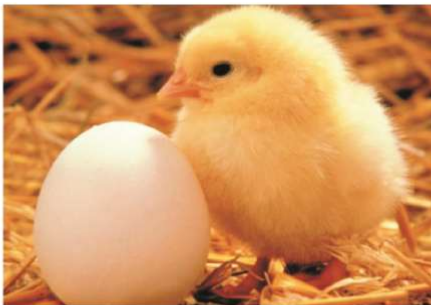
3-nji surat. ROSS-308 krossly bir günlük broýler jüýjesi

Biziň ýurdumyzda has giň ýaýrany ROSS-308 krossyna degişli broýler jüýjeleridir. Bu kross ýokary önümliligi krosslara degişli bolup, häzirki wagtda dünýä bazarynda öňdebaryjylaryň biri bolup durýar.