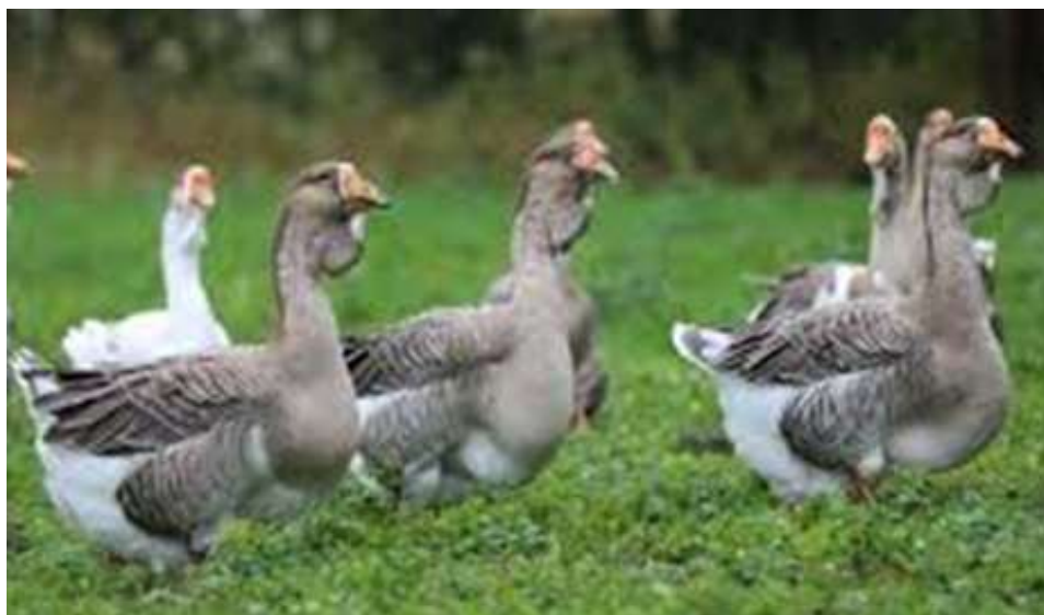
10-njy surat. Kuban tohumly gazy

Iri çal tohumly gazlar romen gazlaryny tuluza gazlary bilen çaknyşdyrmak arkaly döredilipdir. Uly horazlarynyň diri agramy 6,7-7 kilogram, mäkiýanlarynyňky-5,8-6,5 kilogram. 9-hepdelik ýaşyndaky jüýjeleriniň agramy degişlilikde -4,5 we 3,7 kilogram bolýar. Ýumurtga berijiligi 35-45 sany, ýumurtgasynyň agramy 175 gram.