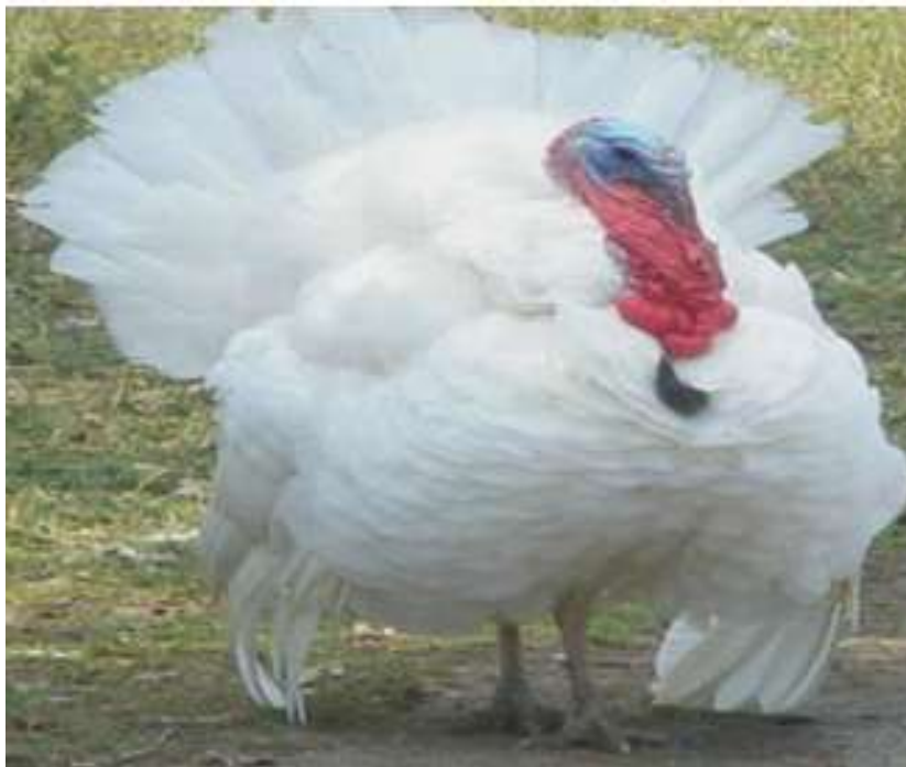
6-njy surat. Ak hindi towugy

Ak hindi towugy. Ak hindi towuklary Timirýazew adyndaky oba hojalyk akademiýasynyň alymlary tarapyndan döredilendir. Hindi towugynyň 140-150 günlük ýaşyndaky jüýjeleriniň diri agramy 5-7 kilograma barabar bolýar, bir kilogram diri agramynyň armagyna 2,8-3,2 kilogram iým harç edilýär. Bu tohum ýaşayşa ukyplylygynyň ýokarydygy we ýerli şertlere gowy uýgunlaşandygy bilen tapawutlanýarlar. Uly ýaşly hindi towuklarynyň ýumurtga berijiligi – 60-70 ýumurtga, ýumurtgadan jüýjäniň çykyjylygy – 65-70 göterim.