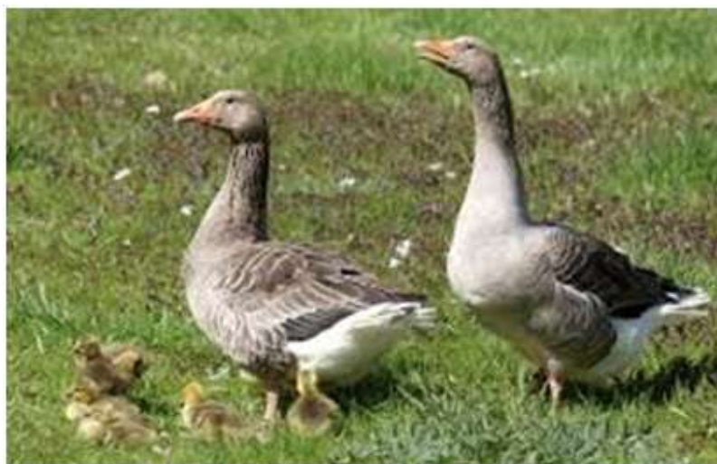
11-nji surat. Iri çal tohumly gaz

Iri çal tohumly gazlar romen gazlaryny tuluza gazlary bilen çaknyşdyrmak arkaly döredilipdir. Uly horazlarynyň diri agramy 6,7-7 kilogram, mäkiýanlarynyňky-5,8-6,5 kilogram. 9-hepdelik ýaşyndaky jüýjeleriniň agramy degişlilikde -4,5 we 3,7 kilogram bolýar. Ýumurtga berijiligi 35-45 sany, ýumurtgasynyň agramy 175 gram.