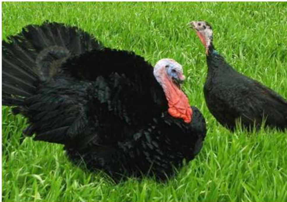
8-nji surat. Gara tihor hindi towugy

Gara tihor hindi towugy. Gara tihor hindi towuklary ýerli hindi towuklarynyň seçgisi esasynda döredildi. Uly ýaşly horazlarynyň agramy 9-10 kilograma, mäkiýanlarynyňky bolsa 4,0-4,5 kilograma barabardyr. Hindi towuklarynyň bu tohumynyň eti tagamlylygynyň ýokarylygy bilen tapawutlanýar. Bu hindi towuklary ýerli şertlere gowy uýgunlaşýarlar, jüýjeleriniň 120 günlük ýaşa çenli ýaşaýşa ukyplylygy 90-98 göterime deňdir. Olar ynjk bolmaýarlar, meýdan şertlerinde hem oňat iýmitlenýärler. Ýylda 70-80 ýumurtga guzlaýar, ýumurtgadan jüýje çykyjylygy – 80 göterim.