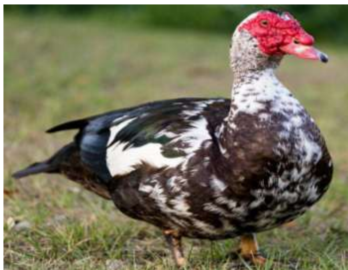
16-njy surat. Muskus tohumy

Muskus ördekleriniň per-ýelek örtügi dürli-dürli, ak, gara, goňur, her hili öwüşgünli bolýar. Olaryň häsiýeti ýuwaş, ynanjaň bolup, beýleki ördekler ýaly gorkak däldirler, az aralyga uçup bilýärler. Horazlarynyň göwresi mäkilerene seredeniňde iki esse agyr bolýar. Senagat usulynda et üçin ösdürlip ýetişdirilende 70-77 günde horazlarynyň diri agramy 3,2-4,1 kilograma, mäkiýanlarynyňky 1,9-2,1 kilograma ýetýär. Eti ýumşak, şireli, özboluşly, ýakymly bolýar. Etiniň ýaglylygy pekin ördekleriňkiden pesligi bilen tapawutlanýar. Muskus ördekleri 6-7 aýlykda ýumurtga berip başlaýar we bir ýylyň dowamynda 90-100 sany ýumurtga berýärler. Ýumurtganyň agramy 72-78 gram aralygynda bolýar.