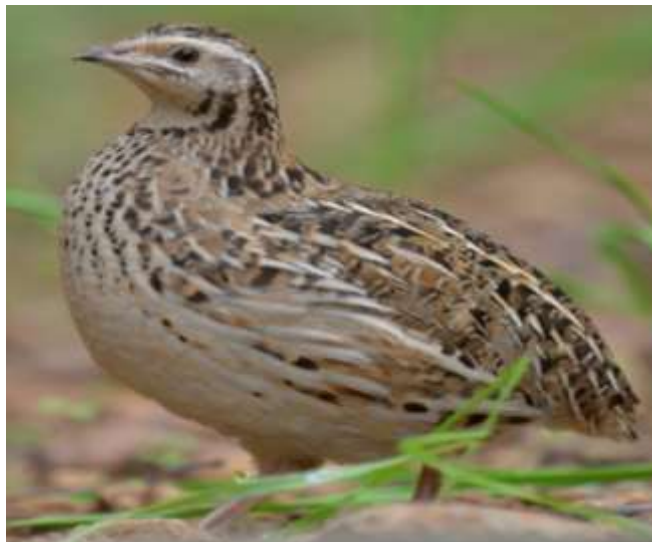
17-nji surat. Faraon bedenesi

Faraon bedenesi. Ol et ugurly bolup, örän tiz ýetişýär. Horazlarynyň diri agramy 150-200grama, mäkiýanlarynyňky bolsa 200-300grama ýetýär, ýumurtga berijiligi ýylda 150-200 sany, ýumurtgasynyň agramy 12-16grama deň bolup 45 günlükde guzlap başlaýar. Jüýjeleriniň diri agramy 4 hepde-de 170-190grama ýetýär.