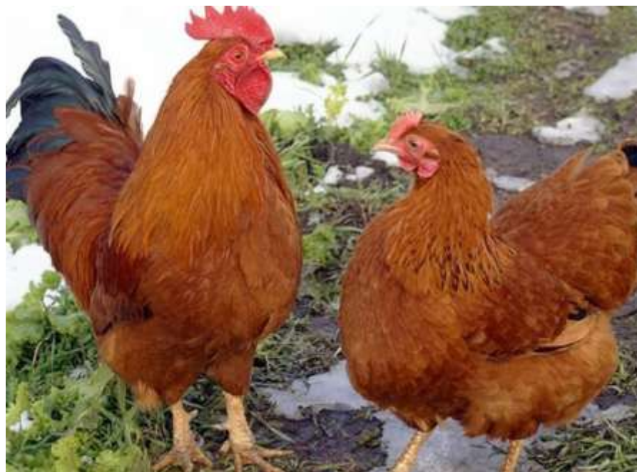
1-nji surat. Lomann Braun krossy

Lomann Braun krossy gyzykly reňkli bolýar. 68 hepdelik ýaşynda diri agramy: towuklarynyňky-2,0-2,2 kilograma, horazlarynyňky-3,0-3,3 kilograma ýetýär. Ýumurtga berijiligi 21-22 hepdelik ýaşynda 50 göterime, 26-30 hepdeliginde iň ýokary derejä ýetip, 68 hepdelikde-265-275, 72 hepdelikde-280-290 sany, agramy 63,9-64,7 grama deň bolan goňur reňkli ýumurtga berýär. Şolardan inkubasiýa goýmak üçin ýaramlysy 68 hepdelikde-240-245, 72 hepdelikde-255-260sany. Jüýjäniň çykymy ortaça – 78-82 göterime deňdir. Ýaşayşa ukyplylygy ortaça 90-96 göterim. Iými sarp edişi: 1-20 hepdelik ýaşynda 8,0 kilograma; 21-68 hepdelikde 40,0 kilograma deňdir.