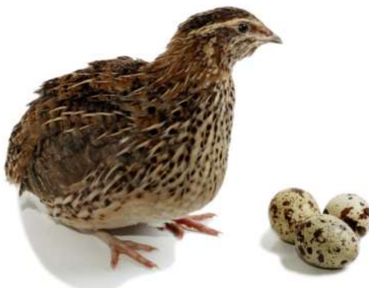
18-nji surat. Ýapon bedenesi

Ýapon bedenesi ýokary ýumurtga önümliligi bilen tapawutlanýar. Bir ýylda 250-300 ýumurtga bermäge hem ukyply bolýar. Mäkiýanlary tiz ýetişýärler we 30-40 günlük ýaşynda ýumurtga guzlap başlaýarlar. Ýumurtgasynyň agramy 9-11 gram. Bu tohumyň horazlarynyň diri agramy 110-130gram, mäkiýanlarynyňky 130-150gram bolýar.