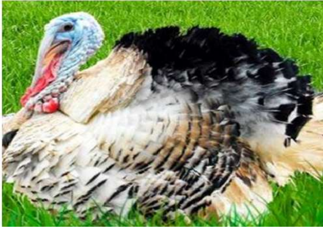
7-nji surat. Kümüşşow hindi towugy

Gara tihor hindi towugy. Gara tihor hindi towuklary ýerli hindi towuklarynyň seçgisi esasynda döredildi. Uly ýaşly horazlarynyň agramy 9-10 kilograma, mäkiýanlarynyňky bolsa 4,0-4,5 kilograma barabardyr. Hindi towuklarynyň bu tohumynyň eti tagamlylygynyň ýokarylygy bilen tapawutlanýar. Bu hindi towuklary ýerli şertlere gowy uýgunlaşýarlar, jüýjeleriniň 120 günlük ýaşa çenli ýaşaýşa ukyplylygy 90-98 göterime deňdir. Olar ynjk bolmaýarlar, meýdan şertlerinde hem oňat iýmitlenýärler. Ýylda 70-80 ýumurtga guzlaýar, ýumurtgadan jüýje çykyjylygy – 80 göterim.