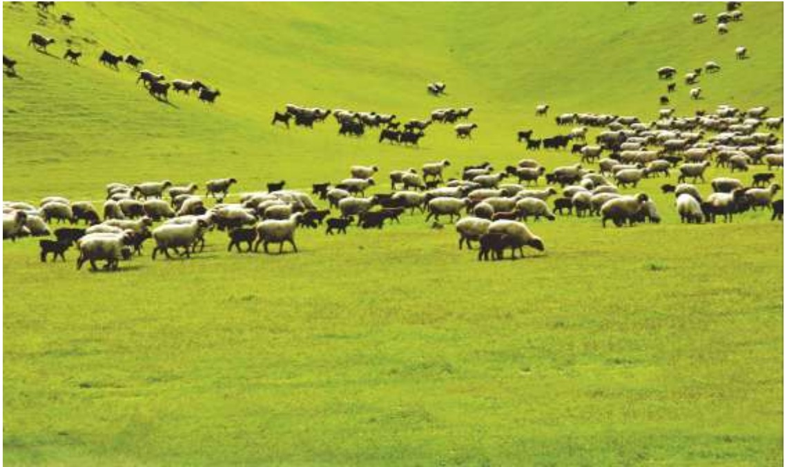
6-njy surat. Saryja ene goýun sürüsi

Saryja goýunlary öz alamatlaryny nesline durnukly geçirip bilýär. Bu tohum Orta Aziýa we Gazagystan ýurtlarynda ösdürilýän irimçik we ýarym irimçik ýüňli guýrukman goýunlaryň tohumyny gowulandyryjy hökmünde ykrar edildi. Saryja tohumly goýunlaryň gatnaşmagynda Täjigistanda et-ýag we ýüň ugurly täjik tohumy, Gyrgyzystanda ýarym irimçik ýüňli, guýrukman alay tohumy, Gazagystanda gargaly we akdepe tohum toparlary döredildi. Häzirki wagtda gargaly we akdepe tohum toparlary ýarym irimçik ýüňli, guýrukman gazak tohumy hökmünde tassyklanyldy. Saryja tohumly goçlar Özbekistan Respublikasynyň, Russiýa Federasiýasynyň Tuwa we Daglyk Altaý ülkelerinde hem-de Mongoliýa Respublikasynyň irimçik ýüňli goýunlarynyň ýüňüniň hilini gowulandyrmak üçin giňden ulanyldy.