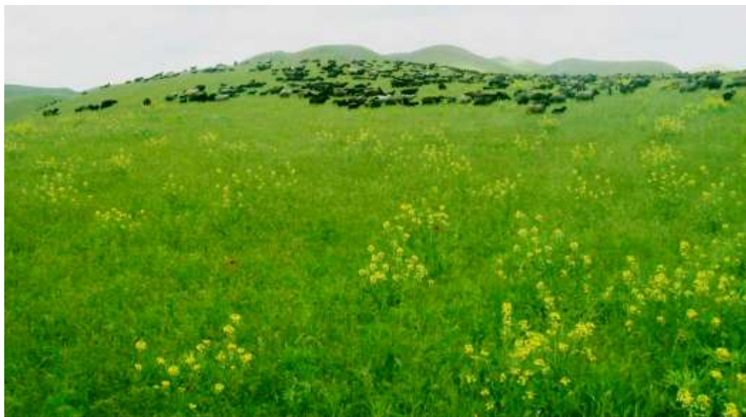
15-nji surat. Ýaz paslynyň örüsi

meýdanlary ýaz ulanmaga düýbünden ýaramsyzdyr. Ýaz möwsümi dowarlar süýji suw bilen üpjün edilmelidir.