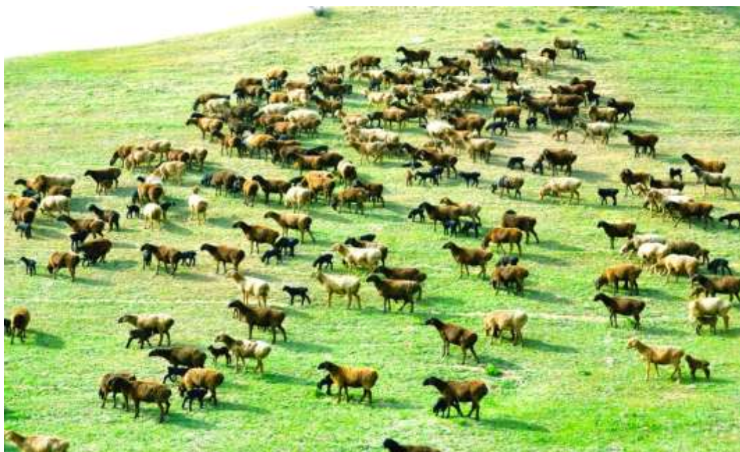
7-njy surat. Gissar tohumly ene goýunlaryň sürüsi

P.F.Kiýatkiniň maglumatlaryna görä Özbekistanyň Surhanderýa welaýatynda ösdürilýän gissar tohumly ene goýunlaryň diri agramy ortaça 70-75 kilograma, uly goçlaryňky bolsa 95-105 kilograma barabardyr. Surhanderýa welaýatynyň çarwadarlary gissar tohumly goýunlary “garakoý” – “gara goýun” diýip atlandyrypdyrlar. Diňe bu goýunlary ösdürmek boýunça Döwlet tohumçylyk hojalyklary döredilenden soň “gissar” goýunlary diýen at ýaýrap başlaýar.