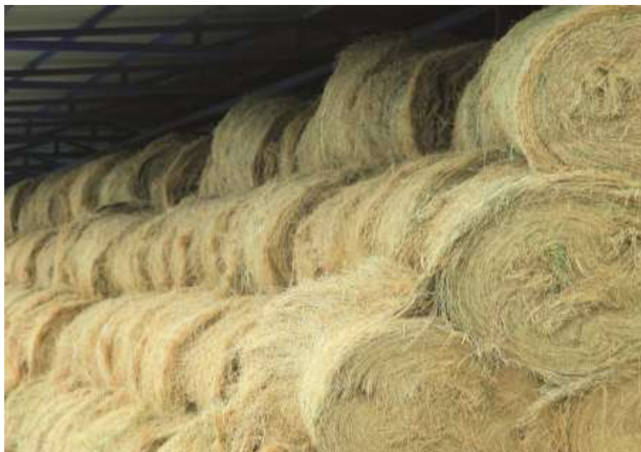
12-nji surat. Gyş möwsümi üçin ätiýaçlyk taýýarlanan bedeler

Ýokarda getirilen ylmy maglumatlar dowarlary gyşlatmaga aýratyn üns bermegiň zerurdygyny görkezýär. Bogazlygyň ikinji ýarymynda (ýanwar-fewral aýlary) ene goýunlara iýmit maddalarynyň, witaminleriň, mikroelementleriň in köp gerek wagty hasplanýar. Bogaz goýunlar hem-ä özlerini saklamaly hem-de göwresindäki gün-günden ösüp, kemala gelýän guzy düwünçegini eklemeli. Bogaz goýunlara bogazlygynyň ikinji ýarymynda örüden alýan otunyň daşyndan her günde 400 gram bede, 200 gram íým berilse, goýnuň guratlygyny saklamagyň we göwresindäki guzyň ösüşini üpjün etmegiň kadaly şertini döreder. Mundan başga-da, goýunlaryň duza bolan islegini kanagatlandyrmak üçin agyllaryň içinde, suw nowalarynyň golaýynda daş duz böleklerini goýmaly.