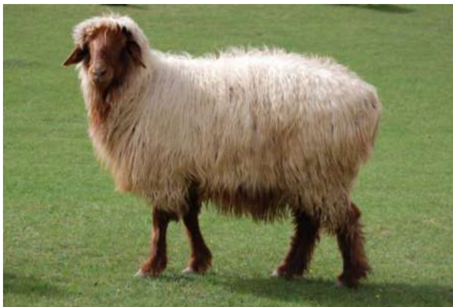
4-nji surat. Saryja tohumly goýun

Saryja goýunlary Ahal welaýatynyň Ak bugdaý, Gökdepe we Bäherden etraplaryna degişli daýhan birleşiklerde we hususy hojalyklarda, şeýle-de beýleki welaýatlaryň hususy hojalyklarynda ösdürilip ýetişdirilýär.