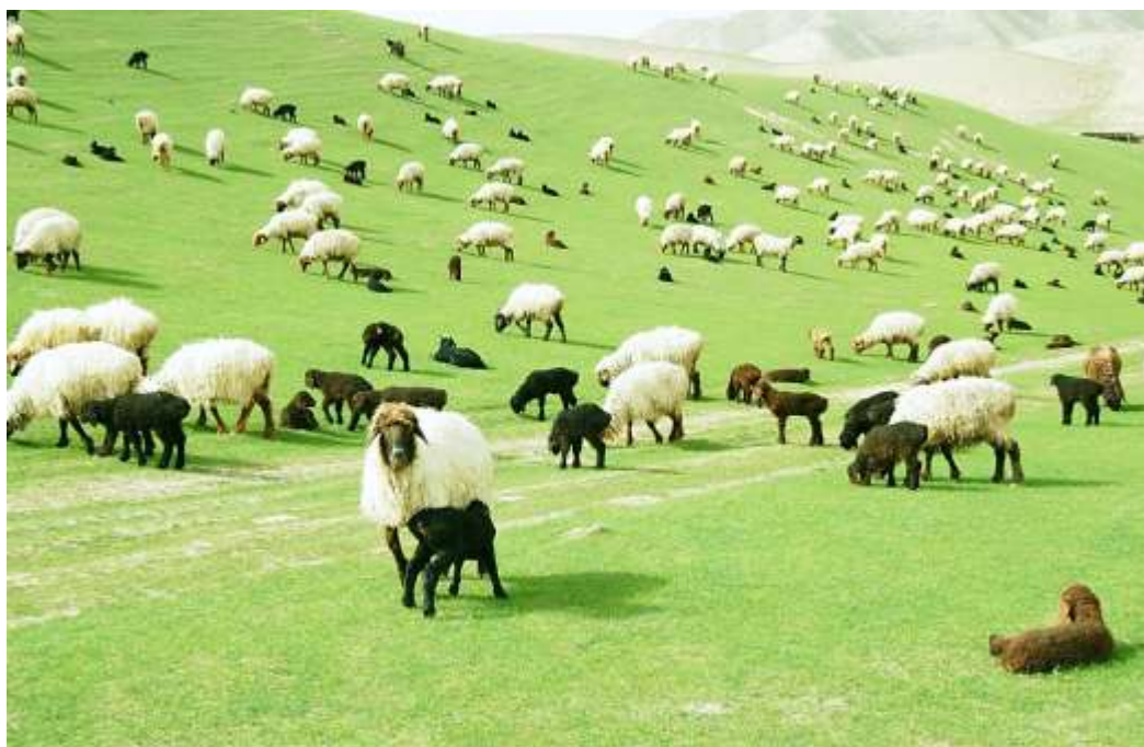
13-nji surat. Guzuly ene goýunlar

Güneşli ýurdumyzda owlak-guzy möwsümi baharyň ilkinji aýy, entäk howa onçakly gyzmaka, salkyn hem-de meýdanda gök ot-çöpleriň boletin öryän döwri geçirilýär. Ony geçirmek üçin mümkin boldugyça tekiz, çägesow, ýelden-şemaldan sowarak örüler saýlanyp alynmaly. Ol ýere bogaz goýunlar möwsümden 15-20 gün öň getirilmeli. Möwsümiň geçiriljek ýerinde bogaz goýunlaryň sürüleri mümkin boldugyndan biri-birine golaýrak ýerleşdirilse, hojalygyň hünärmenlerine çopan toparlaryna ýygy-ýygydan aýlanyp, degişli kömek etmäge, garaköli guzularyna hil taýdan baha berýän hünärmenleriň işiniň ýeňilleşmegine ýadam edýär. Şol döwürde çopanlara goşmaça işçi kömegini bermeli.