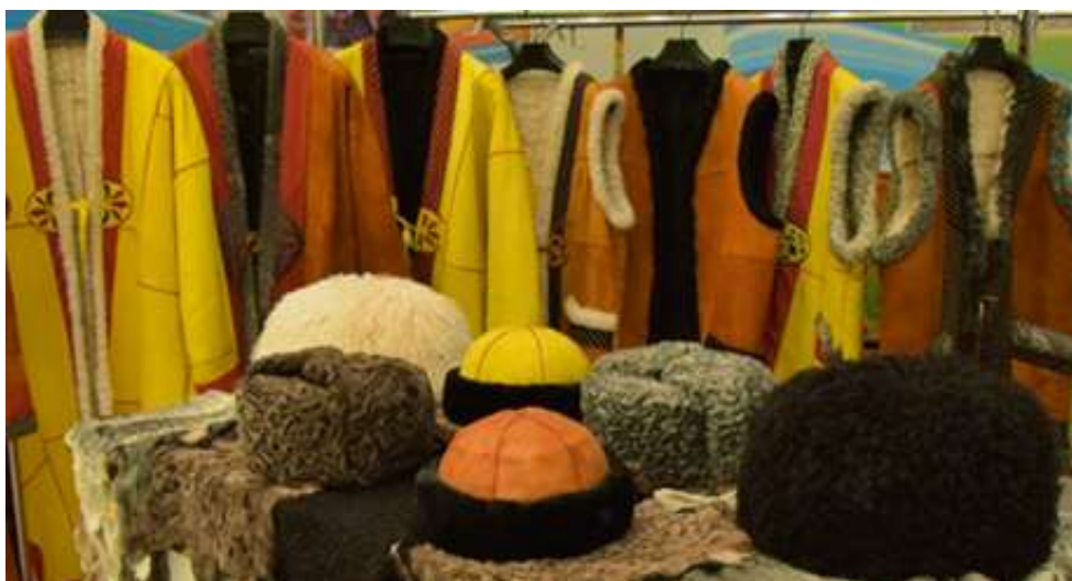
3-nji surat. Dowar derilerinden taýýarlanan milli egin eşikler

Her hili reňklere we öwüşginlere baý, owadan suratly dürli buýraly baganalar täze doglan garaköli guzularyna mahsusdyr. Garaköli tohumy gymmat bahaly garaköli baganalaryndan başga-da et-ýag, ýüň, süýt we deri-gön çig malyny öndürmäge ukyplylygy bilen tapawutlanýar.