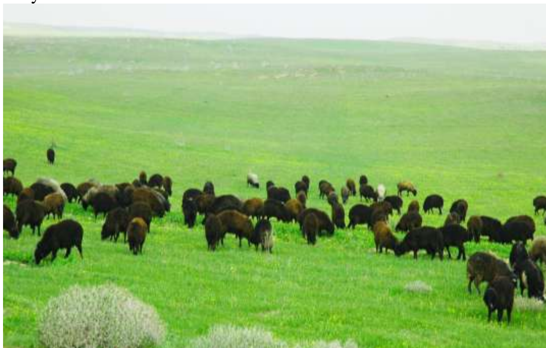
14-nji surat. Sonarly öridäki tokly sürüsi

Halk arasynda “Mal eýesiniň gözünden suw içer” diýen ajaýyp pähim bar. Şu aýdylardan ugur alyp, ýaş toklulardan düzülen sürüleri bakmagy diňe tejribeli çopanlara tabşyrmaly. Öri meýdanlary guýulara golaý bolmaly. Sebäbi ýaş mallaryň suwa talabynyň uludygy üçin, olary günde suwa ýakyp durmaly. Entek aýratyn süri bolup bakylmaga endik etmändigini sebäpli, ýaş toklular ýöremäni kyn görýärler. Eger öri meýdany guýudan daşda bolsa, toklulary her gün suwa indermek köp zähmeti we wagty talap edýär. Gowy örüde toklular täze şertlere tiz öwrenişýärler. Olary bakmak üçin niýetlenen öri meýdanlary ozaldan göz önünde tutulyp, sonarlygyna saklanmaly.