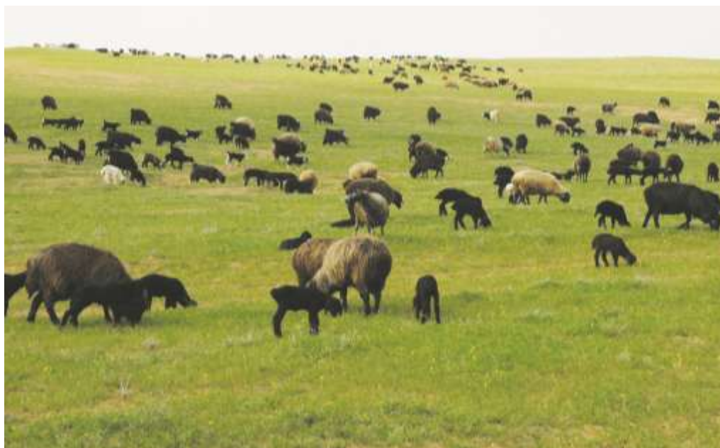
2-nji surat. Garaköli ene goýun sürüsi

Bu goýunlary hojalykda ortaça 6-7 ýyl, käbir ýagdaýlarda bolsa 8-10 ýaşlaryna çenli ulanmak bolýar. Garaköli tohumly goýunlaryň diri agramy ýaşyna görä täze doglan guzulary 4,0-4,5 kilogram, 4,0-4,5 aýlyk (seçim döwri) toklulary 25,0-28,0 kilogram, ýetişen ene goýunlary 45,0-50,0 kilogram, goçlary 60,0-65,0 kilograma barabardyr. Garaköli goýunlarynyň irimçik ýüňli bolup, ýylda iki gezek: ýaz we güyz aýlary gyrkylýar. Ýüň önüm berijiligi ortaça bir baş mala 2,4 kilograma deňdir. Toklular ilkinji gezek 6 aýlyk ýaşynda gyrkylýp, olaryň her birinden 0,8-1,2 kilogram tokly (baýzy) ýüňi alynýar.