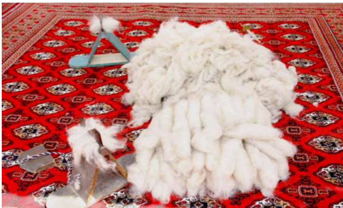
5-nji surat. Saryja goýununyň ýüni

Saryja tohumly goýunlaryň ak reňkli ýarym irimçik ýüni türkmen halylary üçin tapylgysyz çig mal bolup hyzmat edýär. Türkmen halylary bu goýunlaryň ýaz ýüňünden dokalýar. Çünki ýaz ýüňünde sütük süýüminiň uzynlygy ýokary bolup, bu bolsa çig maly egirmäge mümkinçilik berýär. Mundan başga-da saryja ýüňüniň agramly böleginiň (80 göterime golaýy) sütük süýüminden ybarat bolmagy çig mala ýumşaklyk we çeyelik häsiýetini berýär. Ýaz ýüňünden dokalan halylar girmeyär we reňk öwüşginlerini uzak wagtlap saklaýar. Ýüňüň ak reňkde bolmagy ony dürli reňklere boýamaga mümkinçilik döredýär.