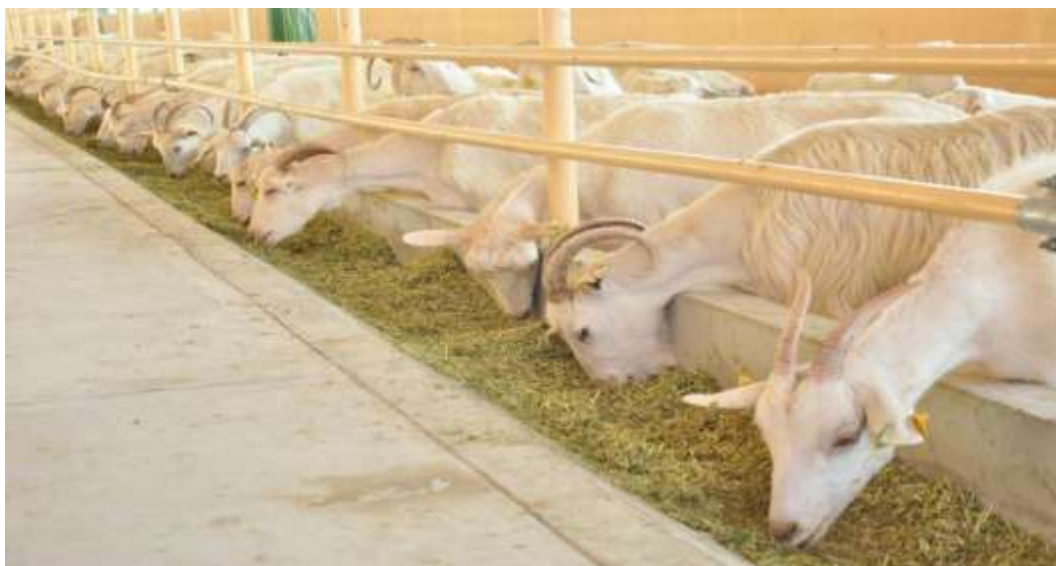
10-njy surat. Süýt ugurly zaanen geçileri

Zaanen geçileriniň et önümliligi kanagatlanarly, derisi ýokary hilli bolmagy bilen tapawut edýär.