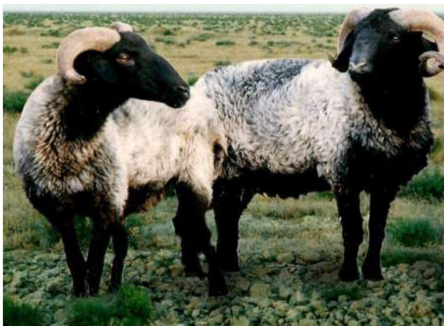
11-nji surat. Garaköli tohumly höwür goçlar

Höwür goçlary möwsüme hemmetaraplaýyn, yhlasly taýýarlamak örän möhümdir. Olaryň gurat bolmagyny gazanmaly. Tohum goçlary güýz aýynda gowy örülerde bakmak, zerurlyk bolsa goşmaça iýmitlendirmek arkaly olary orta we ortadan ýokary semizlik derejesine ýetirmeli. Onuň üçin möwsüme 1-1,5 aý çemesi wagt galanda her höwür goç başyna günde öri otunyň daşyndan goşmaça 1-1,5 kilogram ýorunja bedesi, 0,5 kilograma çenli iým bermeli. Goçlaryň saglyk ýagdaýy mal lukmanlary tarapyndan berk barlanmaly. Olardan barlag üçin gan alyp, barlaghanalarda ýokanç, ylaýtada brusellýoz we beýleki howply kesellerden saplygyny anyklamak gerek. Höwre diňe süňni sagat goçlary goýbermeli. Goýunlaryň tebigy taýdan ekiz guzlaýjylygyny ýokarlandyrmak üçin bir jynsly ekiztaý erkek guzulardan seçilip alnan tohum goçlaryň höwürde ulanylmagy maslahat berilýär. Tohum goçlaryň arasyndan höwür möwsümünde ulanylyp bolmajaklary aýrylyp, olaryň sürüniň üsti ýaş işsek tohum goçlar bilen doldurylýar. Tohum goçlary bakmak diňe aýratyn tejribeli çopanlara tabşyrylýar.