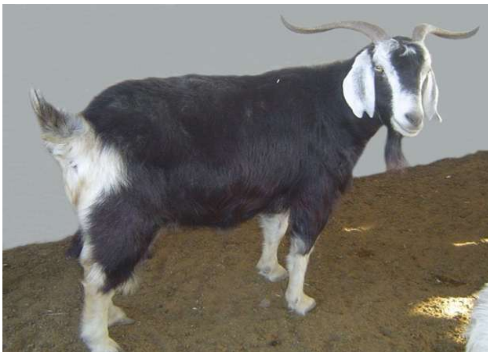
9-njy surat. Gara geçi

Ýerli gara geçiler. Güneşli ýurdumyzda idedilýän geçileriň esasy bölegi çöpür berýän ýerli gara geçileriň tohumyna degişlidir. Türkmen geçileri berk beden gurluşy, berdaşly süňkleri, ýokary derejede uýgunlaşmak häsiýeti, aşa hereketiligi bilen şeýle-de öri ot-çöplerini goýunlara garanda has gowy peýdalanmak ukyby bilen tapawutlanýarlar. Türkmen geçileriniň tutuş endamynyň tüý örtügi aglaba gara reňkde. Olaryň ýüzi köplenç ak ýa-da her geçä mahsus ak, sary ýa-da goňur des-deň (simmetriki) ýerleşen zol-zol we menek-menek şekiller bolýar. Seýrek çypar, ala, has seýrek ýagdaýda bolsa ak geçiler hem duş gelýär.