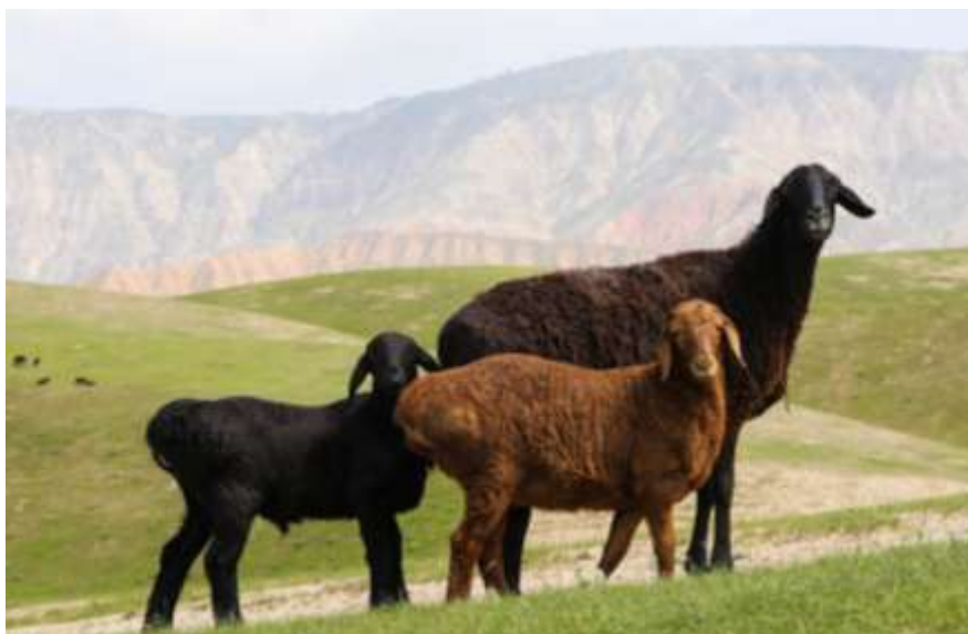
8-nji surat. Gissar tohumly guzuly ene goýun

2003-2006-njy ýyllarda alymlaryň Köýtendag sebitinde geçirilen iş saparlanynyň netijesinde “Türkmenistanda et-ýag ugurly köýten tohumly goýunlaryň ösdürilýän sebitini giňeltmek we bu tohumy netijeli ulanmak hakynda” teklip işlenip düzüldi. Şol teklibiň esasynda 2006-njy ýylyň 4-nji sentýabrynda “Dag örülerini özleşdirmekde ýerli dag goýunlaryny (köýten goýunlaryny) ulanmak barada” diýen buýrugy kabul edildi. Şeýlelikde alymlar tarapyndan et-ýag ugurly köýten goýunlarynyň genofonduny seçgi-tohumçylyk işinde ulanmak arkaly Köýtendag sebitinde ösdürilýän garaköli goýunlarynyň et-ýag önümliligini ýokarlandyrmak boýunça geçiriljek ylmy-barlag işleriniň maksatnamasy düzüldi. Ol “Dag örülerinde ýerleşýän dowardarçylyk hojalyklarynda goýunlaryň et-ýag önümliligini ýokarlandyrmak üçin köýten goýunlarynyň genofonduny ulanmak we bu tohumyň ösdürilýän sebitini giňeltmek” diýen at bilen maksatnamalaýyn ylmy işi 2006-2010-njy ýyllar aralygynda ýerine ýetirildi.