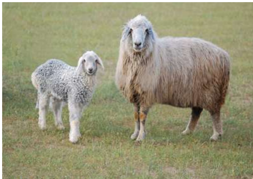
1-nji surat. Çal reňkli guzuly garaköli goýun

Ýurdumyzyň tebigy-howa we öri meýdan şertleri hasaba alnyp, garaköli goýunlaryny reňkine görä saklamak etraplaşdyryldy. Ahal, Daşoguz, Mary welaýatlarynyň etraplarynda gara we çal, Balkan welaýatynda gara, Lebap welaýatynda bolsa gara we sur reňkli goýunlar köpeldilýär.