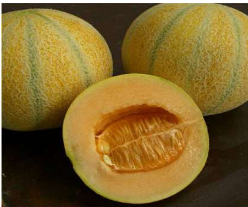
2-nji surat. Gawunyň Kyrkgünlük sorty

Kyrkgünlük - ir ýetişýän sort, köpçülikleýin gögerip çykandan soň 50-60 günden bişip ýetişýär. Bu sortuň gawunlary togalak, paçagy ýuka, ortaça agramy 0,8-1,5 kg çykýar. Miwesiniň tagamy süýji, gandyň mukdary 10-12%-e ýetýär. Ol terligine peýdalanylýar. Gawuny köp wagtlap saklap bolmaýar. Kak etmäge, daş aralyga alyp gitmäge ýaramsyz.