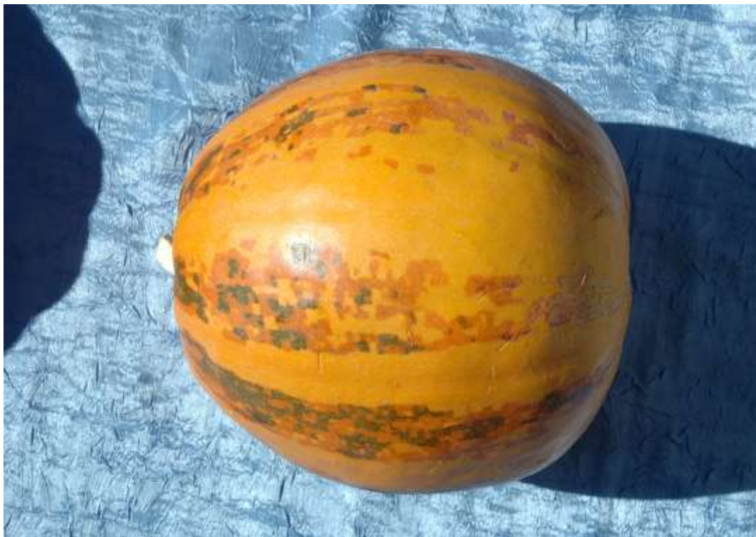
12-nji surat. Ýerli daş kádi

Han kádi – giç ýetişýän sort bolup, 130-140 günde ýetişýär. Onuň kädisi ýasyrak bolup, iki tarapy oýdur, ululygy ortaça. Daşy бүдүр-сүдүррāk, ýarsyndan geçip duran inçejik zolaklary bar, tegmilli, çalyntyk gök reňkli. Paçagy ýuka, gaty. Etiniň galyňlygy ortaça, ol sarymtyl-mämişi reňkli, örän dykyz, guragrak we süýji. Çigit ýerleşýän boşlugynyň ululygy ortaça, sarymtyl reňkli. Türkmenistanyň şertlerinde bu kádi ýokary hasyl berýär. Ony uzak wagtlaп saklap bolýar we daş ýerlere daşamaga ýaramlydyr.