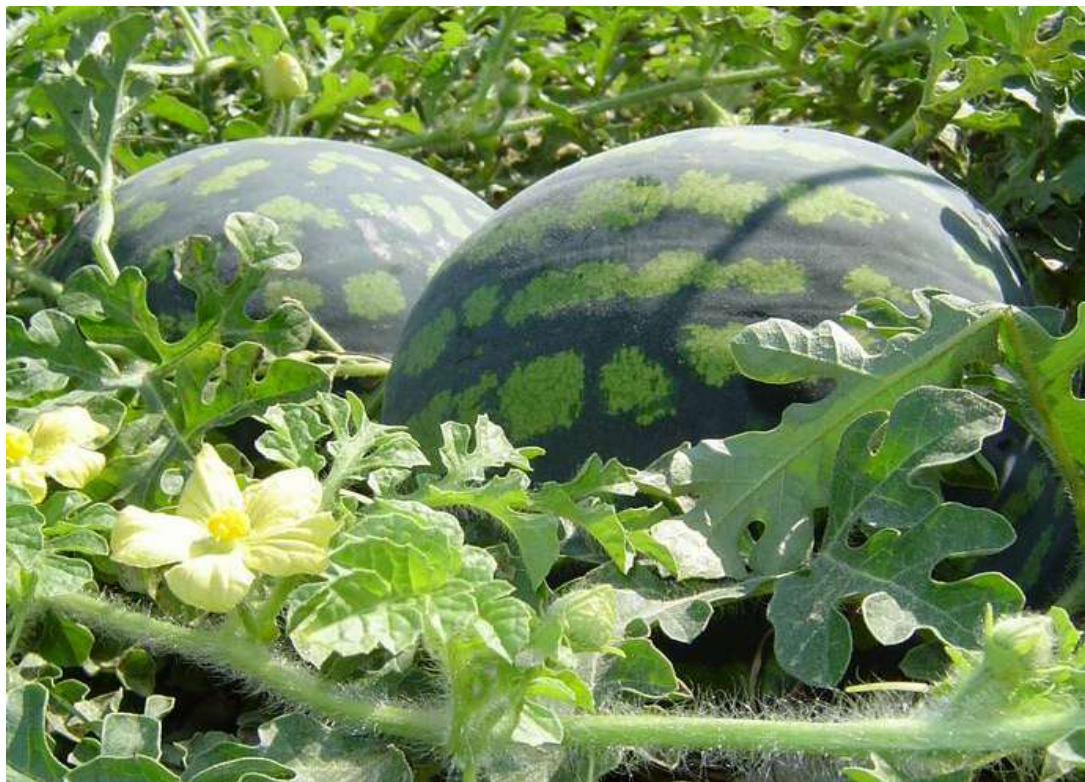
8-nji surat. Garpyzyň Astrahan sorty

Astrahanskiý - aralyk ýetişýän sort bolup, tohum gögerenden soň 80-90 günde bişip ýetişýär. Miwesi şar şekilli, daşy ýaşyl, garaňky zolakly garpyz. Miwesiniň ortaça agramy 3,8-4,2 kg. Miwesindäki gandyň mukdary 8,5-9%, gury maddanyň mukdary 8,2-11,4%, “C” vitamini 6,6-8,7 mg/kg. Her gektardan berýän hasyly 22-25 tonna.