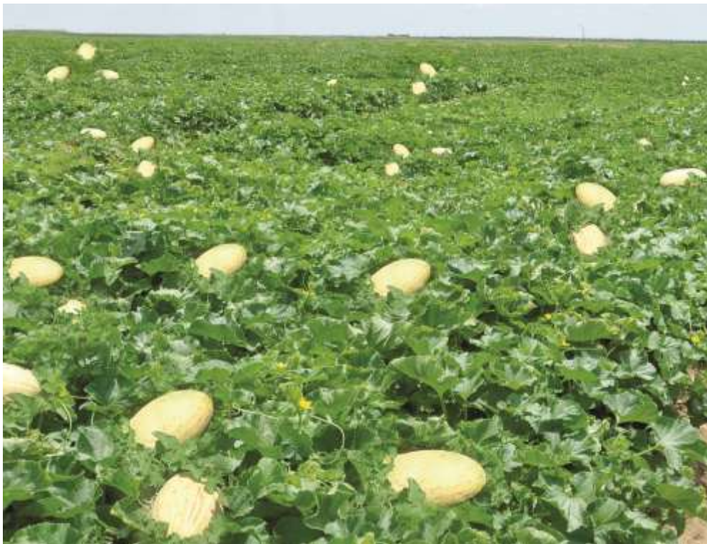
1-nji surat. Gawunyň ýetişen hasyly

Tomus bişer gawunlar toparyna Waharman, Emiri, Mesek, Şekerpalak, Ak gaş, Akmaral, Babaşyh, Gök torly, Ak gawun, Süýt gawun we beýlekiler degişlidir. Tomus bişer gawunlaryň süýjüligi 14-19%-e ýetýär. Tomus bişer gawunlar diňe terligine peýdalanylman, eýsem kak etmäge hem ýaramlydyr.