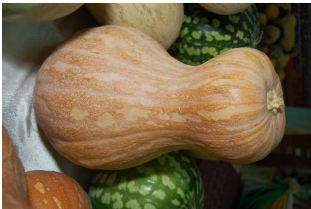
11-njy surat. Palaw kädiniň bişip ýetişen wagty

Palaw kádi - ýerli sort bolup, ýurdumyzda ir döwürlerden bäri ekilip gelinýär. Onuň tohumlary köpçülikleýin gögerip çykandan soň 105-110 günde bişip ýetişýär. Bu sortuň kädisi uzyn, armyt görnüşli, bili bogdaklydyr. Bişen kädisiniň reňki sary bolup, paçagy ýuka bolýar. Agramy 4-6 kg ýetýär. Bu kädiniň eti dykyz we tagamy süýjüdir. Bişen kädiniň düzümindäki gandyň mukdary 11%-e ýetýär. Gektardan hasyllylygy 25-30 tonna ýetýär.