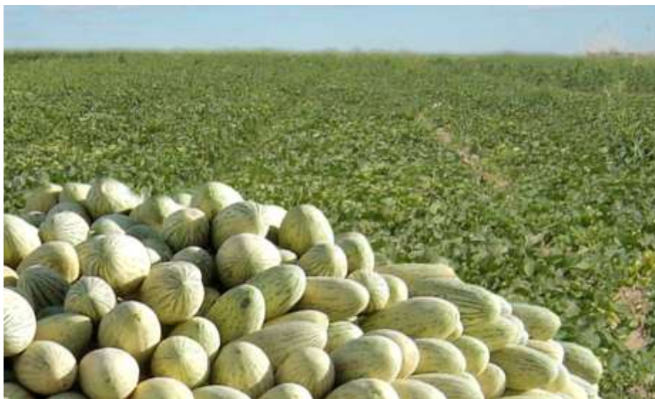
15-nji surat. Gawunyň ýygnalan hasyly

Bakja ekinleriniň bişen döwründe gawunyň paçagynyň reňki sary, gyzyl ýa-da aralyk reňklere öwrülip üýtgeýär, garpyz we kadi hem bişen döwründe sortuna mahsus miweleriniň daşky reňki üýtgeýär. Gawunyň torunyň çyzyklary has görnükli bolýar. Birnäçe sortlaryň paçagynyň daşynda kiçijik jaýryklar emele gelýär. Ir bişer sortlar ýakymly ys berýärler. Ir bişer we orta bişer sortlaryň miwe sapaklary gawundan ýeňil üzülýär. Giç bişer sortlarda tor emele gelip başlamagy gawunyň bişendigini aňladýar, garpyz bişende sapajygyň ýanyndaky murtjagazy guraýar, kadiniň bişenleri reňkini üýtgedýärler.