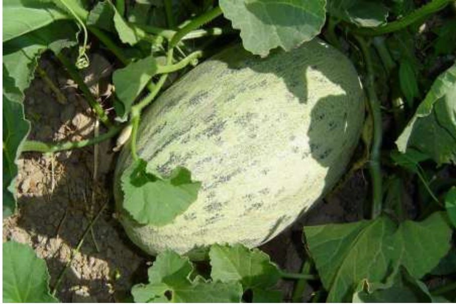
6-nji surat. Gawunyň Akmaral sortunyň bişip ýetişen döwri