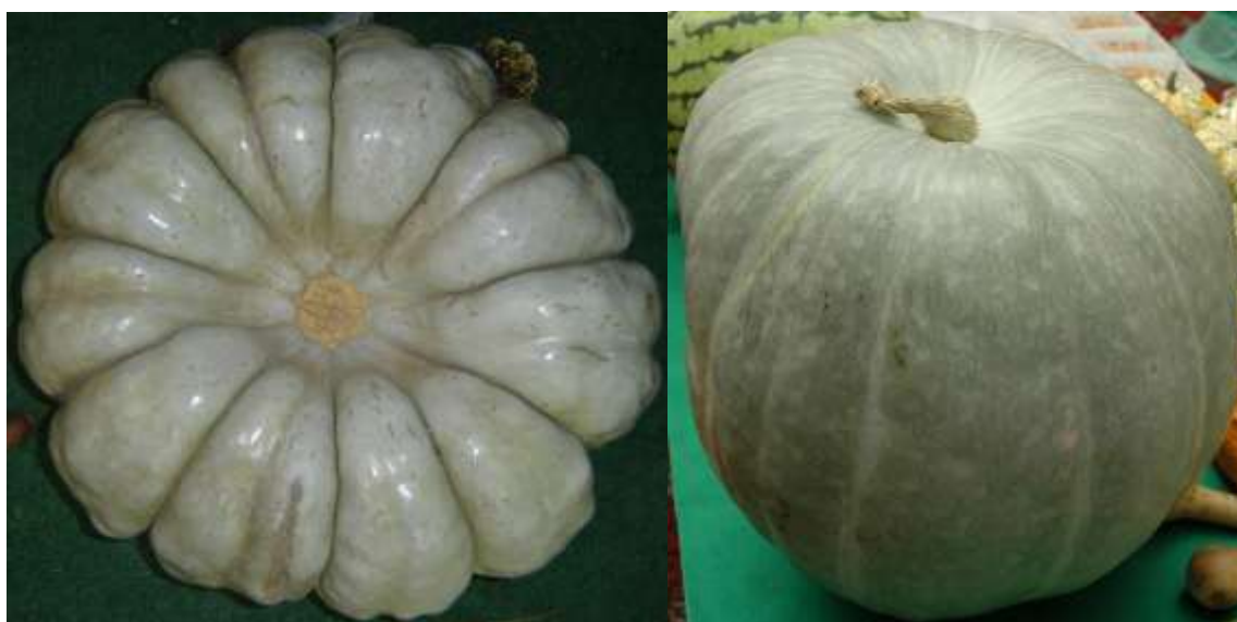
13-nji surat. Kädiniň Han kádi sorty

Han kádi – giç ýetişýän sort bolup, 130-140 günde ýetişýär. Onuň kädisi ýasyrak bolup, iki tarapy oýdur, ululygy ortaça. Daşy бүдүр-сүдүррāk, ýarsyndan geçip duran inçejik zolaklary bar, tegmilli, çalyntyk gök reňkli. Paçagy ýuka, gaty. Etiniň galyňlygy ortaça, ol sarymtyl-mämişi reňkli, örän dykyz, guragrak we süýji. Çigit ýerleşýän boşlugynyň ululygy ortaça, sarymtyl reňkli. Türkmenistanyň şertlerinde bu kádi ýokary hasyl berýär. Ony uzak wagtlaп saklap bolýar we daş ýerlere daşamaga ýaramlydyr.