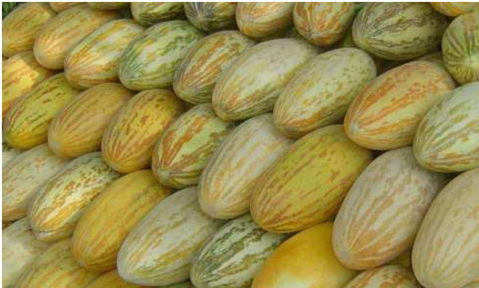
3-nji surat. Gawunyň Waharman-499 sorty

Daşoguz gülabysy - güýz-gyş gawunlaryna degişli bu sort, ýerli gara gülaby sortundan yzygiderli dowamly ýekebara seçgi işleri geçirilip, Daşoguz oba hojalyk tejribe stansiýasynda döredildi. Gögerenden bişýänçä 84-105 gün gerek. Miwesi süýnmek ýumurtga şekilli, agramy 4-5 kg, hektardan berýän hasyly 26 tonna. Eti çala sarymtyl, galyň, dykyz, şireli, tagamy 4,5-5,0 bala deňdir, düzümünde gandyň mukdary 11,0%, uzak ýerlere daşamaga amatly, geljek ýylyň maý aýyna çenli saklamak bolýar.