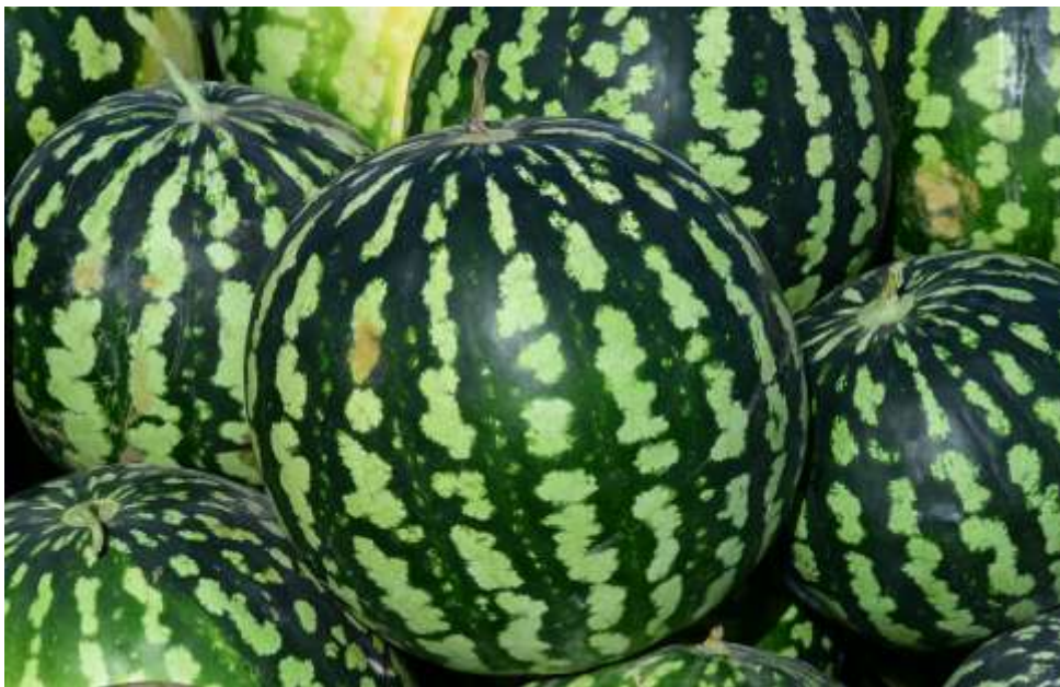
9-njy surat. Garpyzyň Serdar sorty

Bulardan başga-da, daşary ýurtlardan getirilen garpyzyň Krimson Swit we ir ýetişýän garpyzyň 2-3 sany gibrid görnüşleri ekilýär.