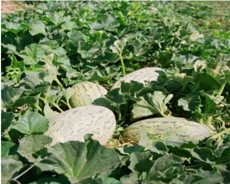
7-nji surat. Gawunyň bişip ýetişen wagty