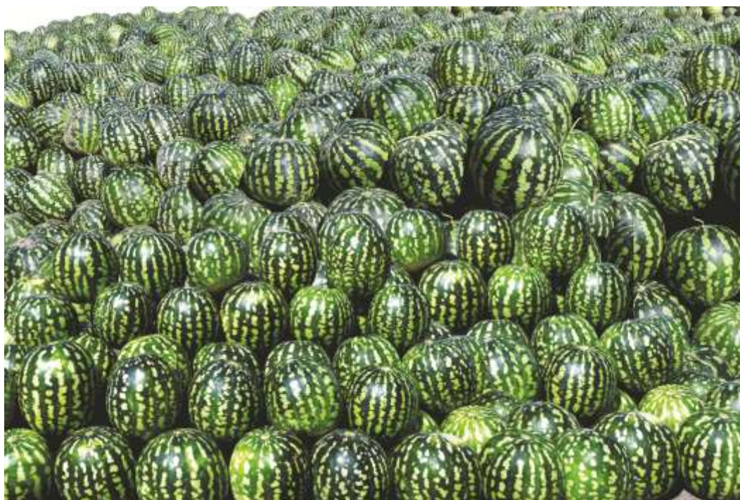
10-njy surat. Garpyzyň ýygylan hasyly