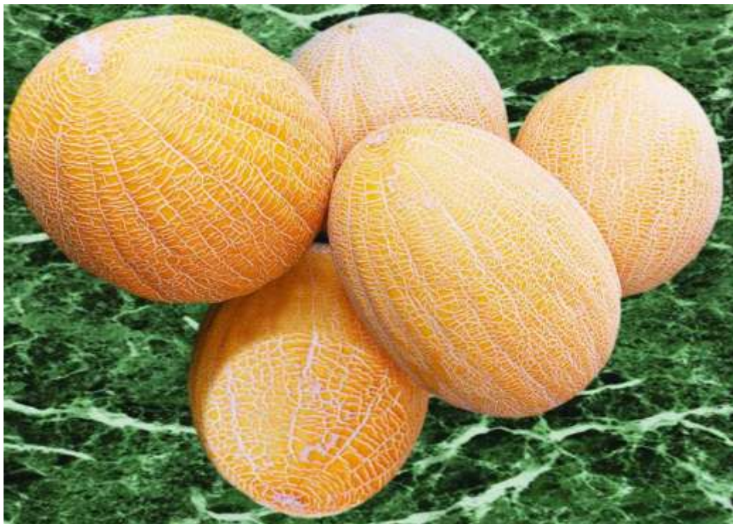
4-njy surat. Gawunyň Gyzyl gülabý-498 sorty

Sary gülabý - ýumurtga görnüşli süýnmek, uzynlygy 40-60 sm, agramy 4-5 kg, biýarasynda 2-4 miwesi bolýar, hasyly gekdardan 25-30 tonna, paçagy ýuka, eti galyňdyr, dykyzdyr, hoşboý ysly, örän süýji tagamly, gandynyň möçberi 16-17%. Giç ekilip, giç ýetişýär, 85-90 günde bişmäge durýar. Iň uzak ýerlere äkitmäge mart aýyna çenli saklamaga ýaramlydyr, tagamy barha süýjeýär. Ahal, Mary, Lebap, Daşoguz welaýatlarynda köp ekilýär. Onuň gowulandyrylan Sary gülabý-497 görnüşi bardyr. Ekiş möhleti 10-20-nji aprel aralygydyr.