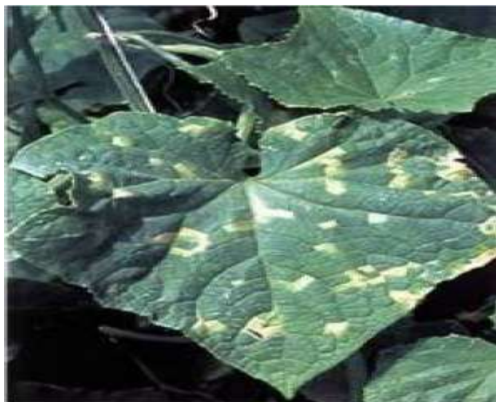
14-nji surat. Ýalan akdüşme bilen kesellän hyýar

Ýalan akdüşme keseli ( Pseudoperonospora cubensis ) bakja ekinlerinde has köp duş gelýän keseldir we esasan gawuna, garpyza, kädä we hyýara zyýan ýetirýär. Ol kesel ilki bilen ösümligiň ýapragynda menekleri ýüze çykarýar, wagtyň geçmegi bilen menekler açyk ýaşyl, soňra bolsa goňur reňkli tegmillere öwrülýär. Tegmilleriň gyrasy burç görnüşinde bolup, olar ýapragyň damarlarynyň aralarynda ýerleşýär we biri-birleri bilen goşulyşýar. Ýapragyň arka tarapynda ilki agymtyl, soňra çal reňkli unjumak kömelegiň maddalary emele getirýär (12-nji surat). Kesellän ýapraklar towlanýar we soňra guraýar. Keseli dörediji kömelegiň sporalary daş-töwerege şemalyň we dürli görnüşli jandarlaryň üsti bilen ýaýraýar.