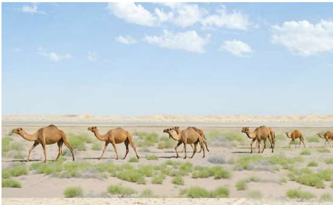
1-nji surat. Düýe sürüsi öri meýdanda

Arwana düýeleriniň esasy ýaýran ýerleri Garagum sähraşydyr. Ulgam-ulgam gum depeleri, takyrlar we şor ýerlerdüýeler üçin öri meýdanlary bolup hyzmat edýärler. Olar sazak, çerkez, çaly, gandym ýaly gyrymsy agaçlar, garak, borjak ýaly şor otlar, ýowşan, selin, ýabagan ýaly otlar bilen iýmitlenýärler. Oazislere golaý ýerlerde düýeler, esasan, ýandak, selme, syrkin ýaly otlary iýýärler, Garagumdaky özünde duzy köp saklaýan guýularyň suwlaryny içip oňup bilýärler. Arwana düýeleri garaköli goýnundan beýleki mallaryň oňup bilmeýän örülerinde iýmitlenip we köpeli bilýärler. Arwana düýeleri gazaply sowuk howa dözümsizdirler. Ýaz, bahar aýlary çöllük örülerde gök otuň, efimer ösümlükleriň ösýän döwründe olar özünü tutýarlar, semizligini dikeldýärler, örküjünde 40-60 kilograma çenli ýag toplan bilýärler.