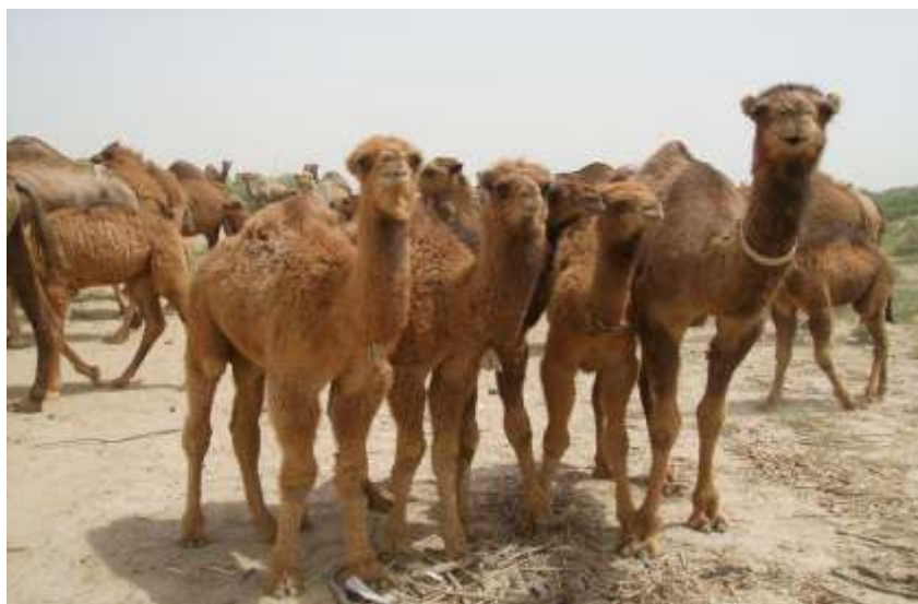
6-njy surat. Torulmar

Düýeleriň saklanylyşy. Düýeler uzak örülerde sürüleýin saklananda, suwa ýakylýan oýlarda ýerli gurluşyk serişdelerinden ýataklar gurmak gerek bolýar. Fermalarda, öri meýdanlarda köp suwly guýularyň ýanynda ýatak jaýlary, saraýlary gurmak gerek. Tomus aýlary uzak örülerde düýeleri gabamak üçin, ýelden sowa ýerlerde meýdan ýatak ýerlerini, ygalary ulanmak bolar.