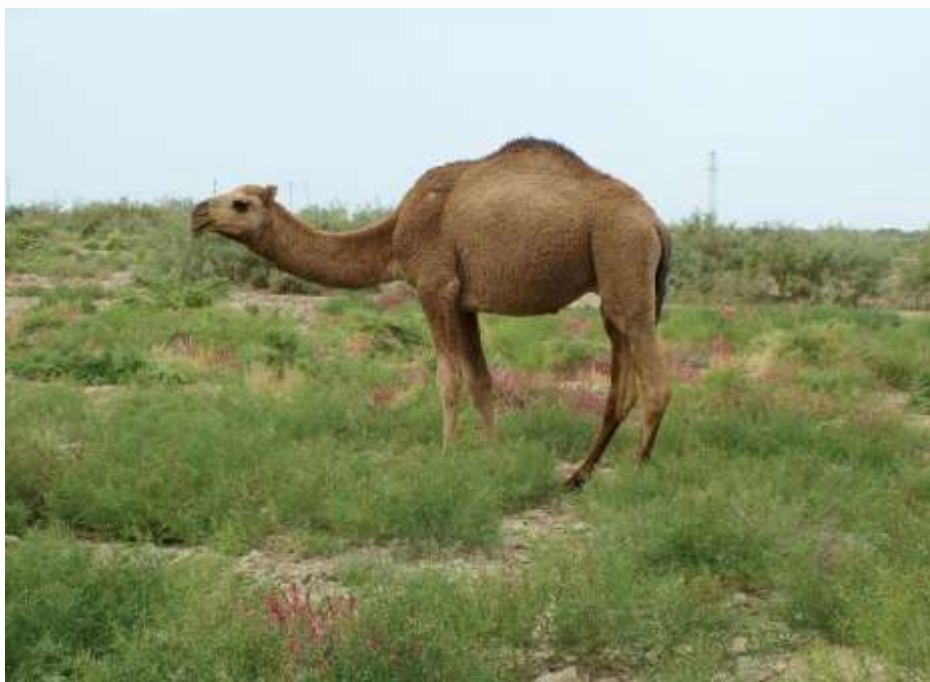
9-njy surat. Arwana tohumly inen düýe

Arassa tohumda köpeltmek. Düýe tohumlaryny köpeltmekde tohumyny arassa köpeltmek esasy usul bolup, onuň maksady ýokary önümlü düýeleriň nesil çeşmesini döretmekdir, bu bolsa erkekleri seçip almak, ylmy taýdan maksadalaýyk jübütleşdirmek we tohum köşekleri ösdürip ýetişdirmek ýaly meseleleri öz içine alýar. Iki örküçli we bir örküçli düýeleriň tohumlarynyň ýaşýan ýerlerine baglylykda, öz gymmatly taraplary bardyr. Çalasyn hereketli düýeleriň arap ýurtlaryndaky tohumlary, türkmen arwana düýesi, iki örküçli baktrianlaryň galmyk, gazak we mongol tohumlary ýerli şertlere we belli-belli önüm bermeklige uýgunlaşan bolup, olaryň tohumy arassa köpeldilip kämilleşdirilýär. Tohumy arassa köpeltmekde ugurlar boýunça köpeltmek, garyndaşlykda we garyndaş däl köpeltmek, arwana düýedarçylygynda bolsa ene inenler maşgalasyny göz önünde tutup köpeltmek ýaly usullar ulanylýar.