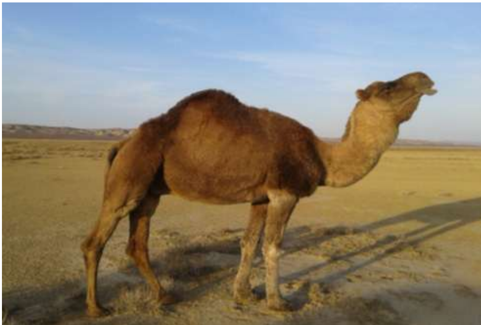
8-nji surat. Arwana tohumly höwür erkek düýe

Ýokary klasly tohum düýeler bilen işlenilende peýdaly tohumçylyk alamatlary, klasly we önümliligi, görnügi boýunça meňzeş erkeklere şonuň ýaly inenler jübütleşdirilýär. Munuň özi aralyk garyndaşlykda köpeldilip, düýeleriň peýdaly tohumçylyk häsiýetlerini nesilde berkitmäge kömek edýär. Gowyny gowy bilen köpeltmek sürüdüki mallary has gowulandyrýar. Şeýle jübütleşdirme islenilýän görnügini we häsiýetlerini durnukly ýagdaýda nesle geçirýän düýeleri almaga kömek edýär.