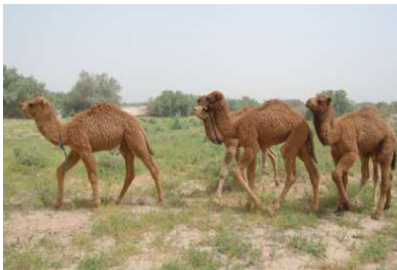
2-nji surat. Köşekler örüde

Köşek emdirýän düýeleriň ýelnini gözegçilikde saklamaly, hapalanmagyna, ýelin agyry bolmagyna ýol bermeli däl. Düýeleriň ýelin agyry zerarly soňra az süýtli bolmagy mümkin. Soňabaka köşekleri her 4 sagatdan gündizlerine we gijelerine emdirmeli.