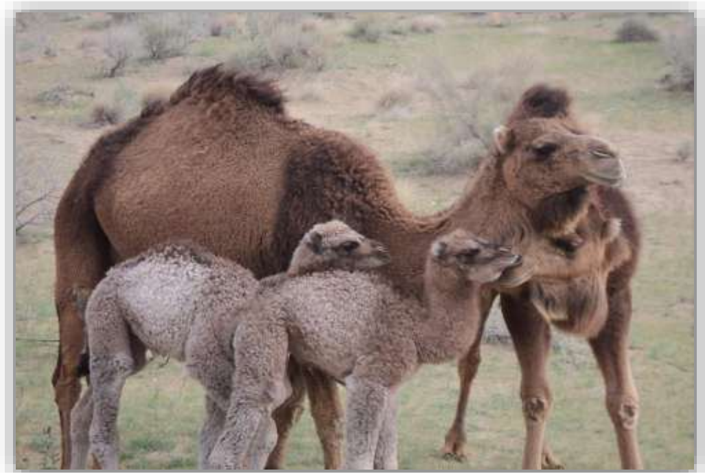
3-nji surat. Köşekli düýe

Howanyň maýyyl günleri 15-20 günlük köşekleri eneleri bilen 3 kilometrden uzak bolmadyk öri meýdana bakmaga çykarmak bolar. Howa sowasa, köşekleri ýatakda saklamaly. Agylda saklanylýan döwri köşekleriň iým ahyrynda daş duzunyň bölegini goýmaly, bogdaklanan ýorunja bedesini asyp goýmaly, köşekler ony iýip otugmaly.