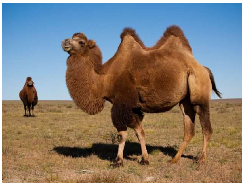
10-njy surat. Iki örküçli baktrian tohumly düýe

Düýeleri tohumara çakyşdyrmak usuly –Iki örküçli baktrian tohumlaryny köpeltmekde giňden ýaýrapdyr. Şunda Galmyk baktrianlary gazak we mongol düýeleriniň hilini gowulandyrmak maksady bilen çakyşdyrylýar. Gazak baktrianlaryny mongol düýeleri bilen çakyşdyrmak Gazagystanda ýylboýy örüde saklamaga çydamly düýeleri almaga kömek edýär.