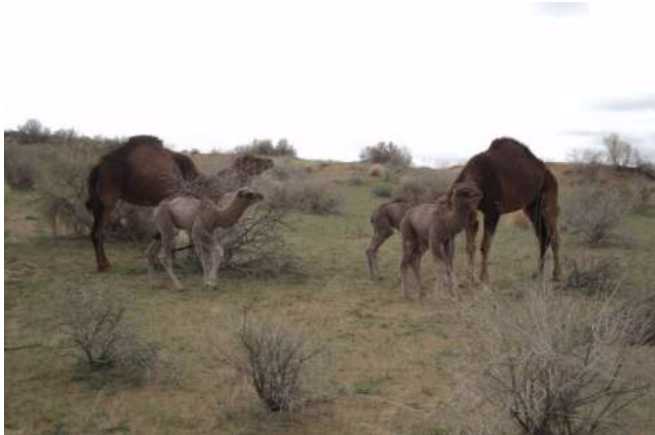
4-nji surat. Köşekli düýeler

köp bolmadyk ýagdaýlarynda köşekleri ene düýeleriň sürüsine goşup saklamak bolar.