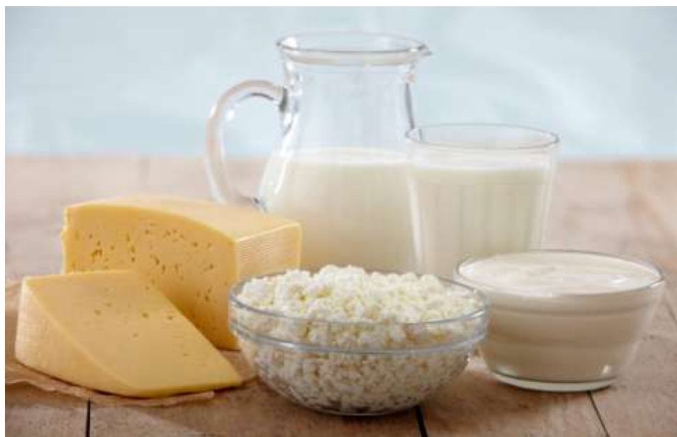
7-nji surat. Düýe süýdünden taýýarlanýan önümler

Düýe süýdünden taýýarlanýan önümler. Düýe süýdünü tehnologiýa taýdan işläp, islendik süýt-gatyk, mesge ýagy, syr, guradylan süýt we ş.m. ýaly azyk önümlerini öndürmek bolýar. Türkmenistanda düýe süýdi çal, agaran we az mukdarda doýran öndürmek üçin ulanylýar.