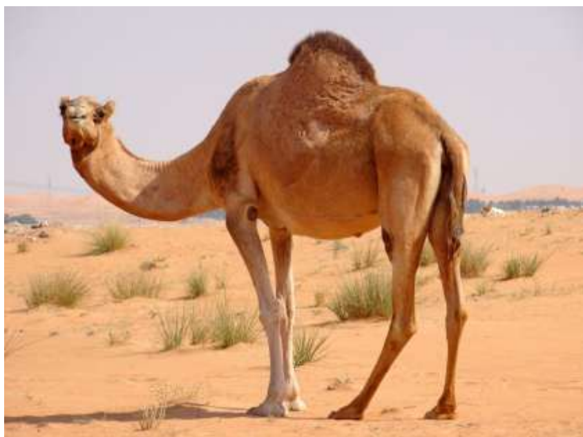
11-nji surat. Arwana tohumly inen düýe

Tohumçylyk hasabatyny ýöretmek. Arwana tohumly düýedarçylyk hojalyklarynda köşekler doglanda, olara at dakylp doglan senesi, reňki, ene-atasy bellige alnyp, resmi ýazgylarynyň hasabaty ýöredilýär. Harytlyk hojalyklarda düýeleriň sany köp bolanda we örülerde saklanyp köpeldilende olaryň her birine at dakyp, hasabatyny ýöretmek kyn bolýar. Düýeler biri-birinden reňki we nyşanlary boýunça kän bir tapawutlanmaýarlar. Bu hojalyklarda ýaş köşekleriň gulagyna san belgilenen syrga dakmak bilen hasaba alnýar, at dakylýar.