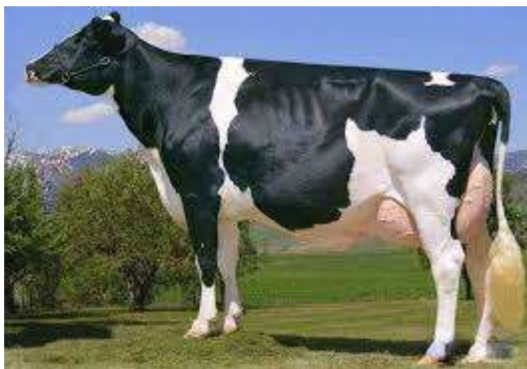
4-nji surat. Sygyryň Gara ala tohumy

Gara ala tohumy. Gara ala tohumy dünýäde giňden ýaýran tohumlaryň biridir. Olar sagym döwründe 4000-4500 kilogram we ondan hem ýokary süýt berýär. Süýdüniň ýaglylygy 3,0-3,2 göterime deňdir. Sygyrlaryň diri agramy 450-600 kilograma, öküzleriňki 960-1200 kilograma, öküzçeleriň diri agamy bolsa 18-20 aýlykda 450-550 kilograma ýetýär.