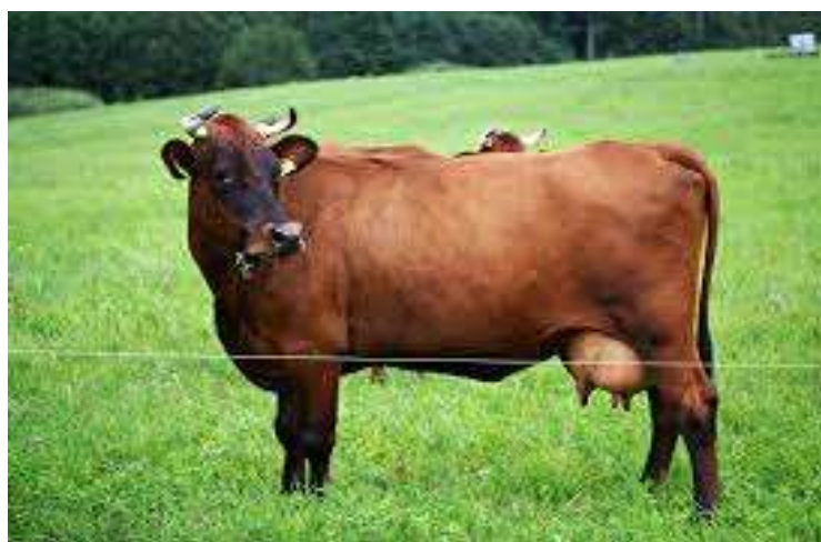
2-nji surat. Sygyryň Goňur latwiýa tohumy

Goňur latwiýa tohumy. Goňur latwiýa tohumy reňki gyzyl, süýt ugurly mallara degişli bolup, ýurdumyza 1960-njy ýyllarda getirildi. Bu mallar esasan Daşoguz welaýatynyň hojalyklarynda ösdürilýär. Sygyrlaryň diri agramy 400-420 kilograma, öküzleriňki 750-800 kilograma, öküzçeleriňki bolsa baka goýlanda 18-20 aýlykda 400-450 kilograma ýetýär. Süýt önümliligi sagym döwründe 2500-3000 kilogram bolup, ýaglylygy 3,9 göterime çenli bolýar.