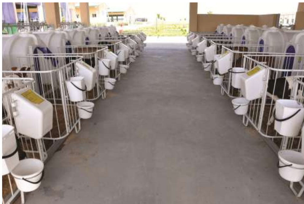
10-njy surat. Ýaş göleleriň saklanýan ýatagy

Ikinji aýda otugyp başlaýar we berilýän süýdünň mukdary 2,5-3 kilogramdan az bolmaly däl, üçünji aýda 1,0-1,5 kilogram töweregi süýt bermeli. Jemi 3 aýyň dowamynda her bir tüwe göle 225 kilogram, öküzçe 250 kilogram süýt içirilse, olaryň 6 aýlykdaky diri agramy 90-100 kilograma, gowy seredilende 150-160 kilograma ýetýär. Owuz süýdünden soň göleler el bilen bedreden, ýörite emzikli polietilen çüýşeden emdirilýär. Berilýän süýdünň ýylylygy 36-37 derejede bolmaly. Sowuk süýt göleleriň içini geçirýär. Süýt 1 aýlyga çenli günde 3 gezek, soň 2 gezek berilýär.