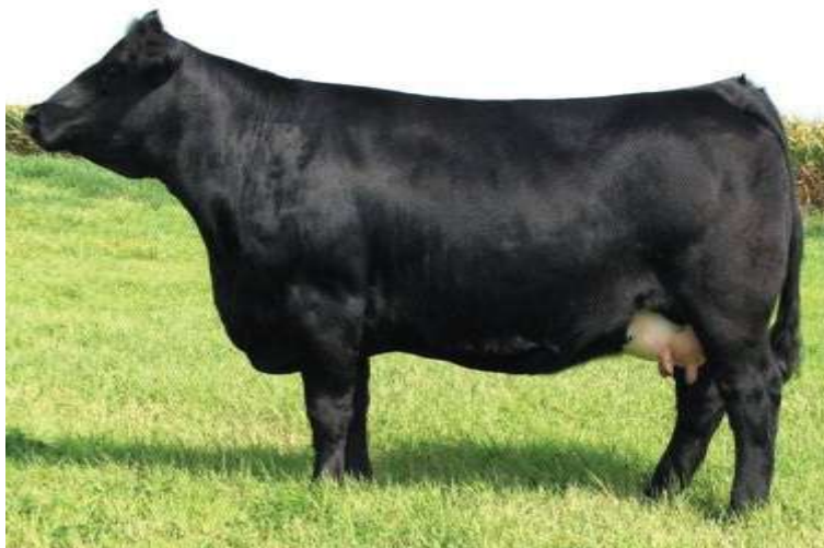
9-njy surat. Sygyryň Aberdeen-angus tohumy

ýetişýänligi, özboluşly beden gurluşy, dürli tebigy howa şertlerine uýgunlaşmaga ukyplylygy, kesellere durnuklylygy, asuda häsiýetlilik we ýokary önümliligi bilen beýleki tohumlardan tapawutlanýarlar. Sygyrlarynyň diri agramy 500-700 kilograma, öküzleriňki 750-1000 kilograma, öküzçeleriň diri agamy bolsa 16-18 aýlykda baka goýlanda 450-460 kilograma ýetýär. Onyň süýt önümliligi ýylda 2000 kilograma çenli ýetýär.