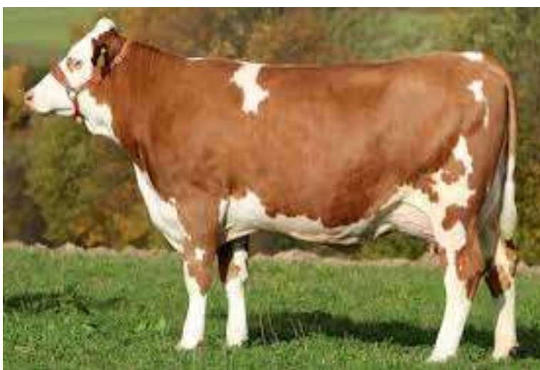
6-njy surat. Sygyryň Simmental tohumy

Simmental tohumy. Bu tohum gara mallaryň et-süýt ugruna degişli bolup, dünýäde giňden ýaýran tohumlaryň biridir. Reňki gülgüne öwüşginli açyk sary, kellesi we guýrugynyň uýy ak, burnunyň üsti açyk gyzyl bolýar. Ýurdumyza 2014-nji ýylda Türkiýe döwletinden getirildi. Sygyrlaryň diri agramy 550-650 kilograma, öküzleriňki 800-1100 kilograma, öküzçeleriň diri agamy bolsa 18-20 aýlykda 500-550 kilograma ýetýär. Süýtlüligi ýokary, ýylda 9000 kilograma çenlisüýt berýär, ýaglylygy 3,9 göterime deňdir.