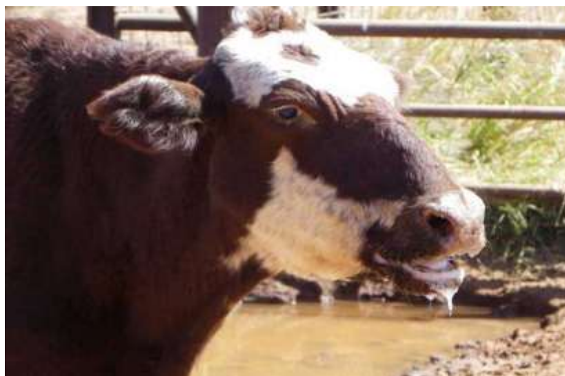
14-nji surat. Agsyl keselli sygyr

Keseliň alamatlary. Keseliň gizlinlik döwri 2-7 gün dowam edýär. Kesel başlanda ilki malyň işdäsi peselýär, sygyrlaryň süýdi keseliýär, beden gyzygynlygy 41,5 derejä ýetýär we nemli bardalary guraýar. 2-3-nji gün diliniň, dodagynyň, burnunyň nemli örtüklerinde aftlar emele gelyär. Tüýkülik akmagy güýçlenýär, mal agsap ýöreyär we köplenç turup bilmän ýatýar. Wagtynda weterinar kömegi berilmese, beýleki keseller (mastit, dermatit) bilen beterleşip heläk bolmagyna getirýär. Kähalatlarda gara mallaryň 2-3 hepdeden sagalmagy bilen tamamlanylýar.