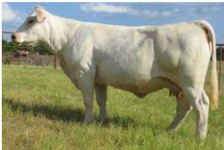
7-nji surat. Sygyryň Şarala tohumy

545-570 kilograma, öküzleriňki 860-900 kilograma, öküzçeleriň diri agamy bolsa 15-18 aýlykda baka goýlanda 520-610 kilograma ýetýär.