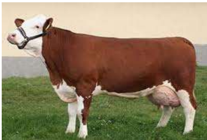
5-nji surat. Sygyryň Monbelýard tohumy

Olaryň süýt önümliligi 8500 kilograma çenli bolup, ýaglylygy bolsa 3,89 göterime deňdir. Sygyrlaryň diri agramy 650-700 kilograma, öküzleriňki 1000-1200 kilograma, öküzçeleriň diri agamy bolsa 16-18 aýlykda 450-480 kilograma ýetýär.