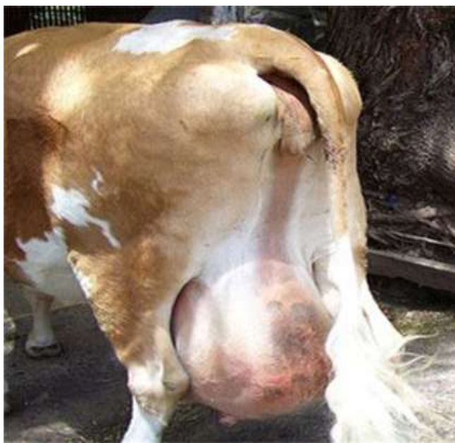
12-nji surat. Ýelin agyry keseliniň alamaty

Keseliň alamatlary. Ýelinagyry keselinde sygryň ýelni çişýär, gyzgynlygy ýokarlanýar, ýelini elläniňde mal agyryny duýýar. Bu kesel malyň işdäsiň kesilmegine, gyzgynynyň galmagyna hem-de süýdüniň reňkiniň üýtgemegine getirýär. Wagtynda bejerilmese, ýelniň çişäniň garnynyň we yzky aýagynyň derisiniň aşagyna ýaýrap, keselli malyň ýagdaýy erbetleşip, emzikleriň dykylmagyna getirýär. Ýelniň zeperlenen böleginden uýan süýt gelýär, köplenç süýde derek bulanyk suwuklyk bölünip çykýar. Kähalatlarda süýtdä gän ýa-da iriň garyndysy bolýar.