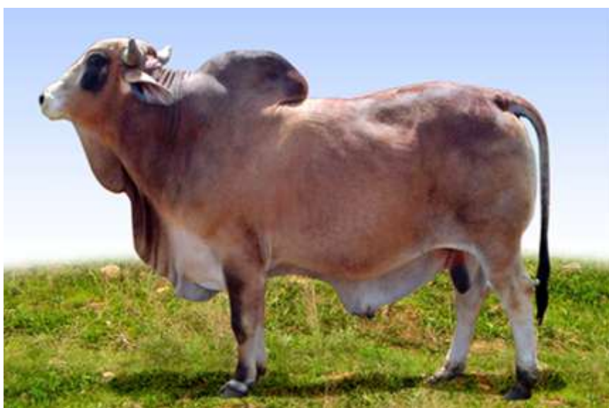
8-nji surat. Sygyryň Kuba zebu tohumyna degişli öküz.

Sygyrlaryň diri agramy 500-550 kilograma, öküzleriňki 900-1100 kilograma, öküzçeleriň diri agamy bolsa 18-24 aýlykda baka goýlanda 407-487 kilograma ýetýär.