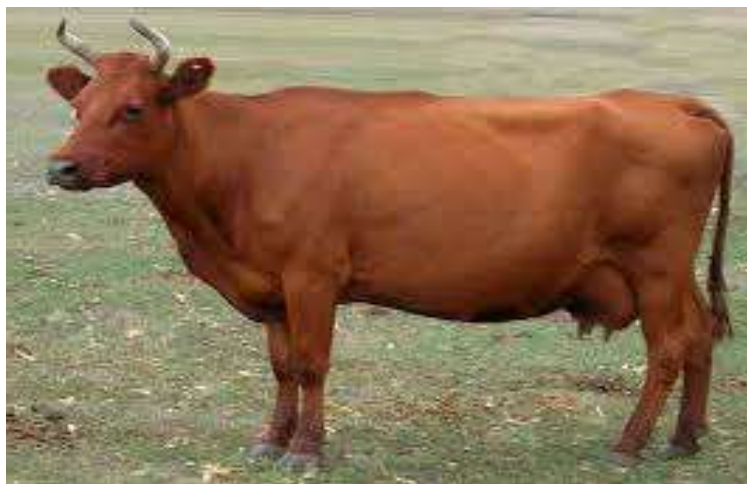
1-nji surat. Sygyryň Gyzyl sähra tohumy

Gyzyl sähra tohumy ýerli howa şertlerine gowy uýgunlaşyp, sagym döwründe 2500-3000 kilogram süýt berýär. Sýüdüniň ýaglylygy 3,8 göterime deňdir. Sygyrlaryň diri agramy 380-400 kilograma, öküzleriňki 650-700 kilograma, öküzçeleriňki bolsa baka goýlanda 18-20 aýlykda 400-450 kilograma ýetýär.