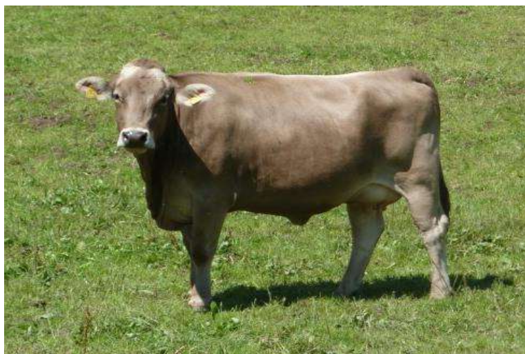
3-nji surat. Sygyryň Şwis tohumy

Şwis (şwislendirilen) tohumy. Şwis tohumy süýt-et ugurly mallara degişli bolup, biziň ýurdumyza 1936-1938-nji ýyllarda ýerli mallaryň tohumyny gowulandyrmak üçin getirildi. Olar ýerli şertlere gowy uýgunlaşyp, sagym döwründe 3000-3500 kilogram, ýaglylygy 3,8-3,9 göterime deň bolansüýt berýär. Sygyrlaryň diri agramy 400-450 kilograma, öküzleriňki 800-1000 kilograma, öküzçeleriň diri agamy bolsa 18-20 aýlykda 450-470 kilograma ýetýär.