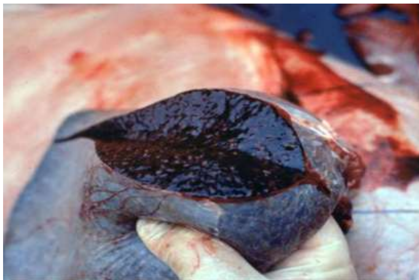
13-nji surat. Otbaş keselinden zeperlenen dalak

Otbaşdan ölen mallaryň maslygy keseliň ýaýramagynyň iň bir howply ýagdaýy hasaplanylýar. Güman edilýän ýa-da şu keselden ölen malyň maslygyny kesmek, açmak düýbünden gadagandyr. Otbaşdan ölen malyň maslygy çişýär, tebigy deşiklerinden gan gatyşykly suwuklyk bölünip çykýar, deride gaty we agyrak, soňra ýumşak dorag pisintli çişler bolýar. Gany garamtyl reňkde bolup lagtalanmaýar.